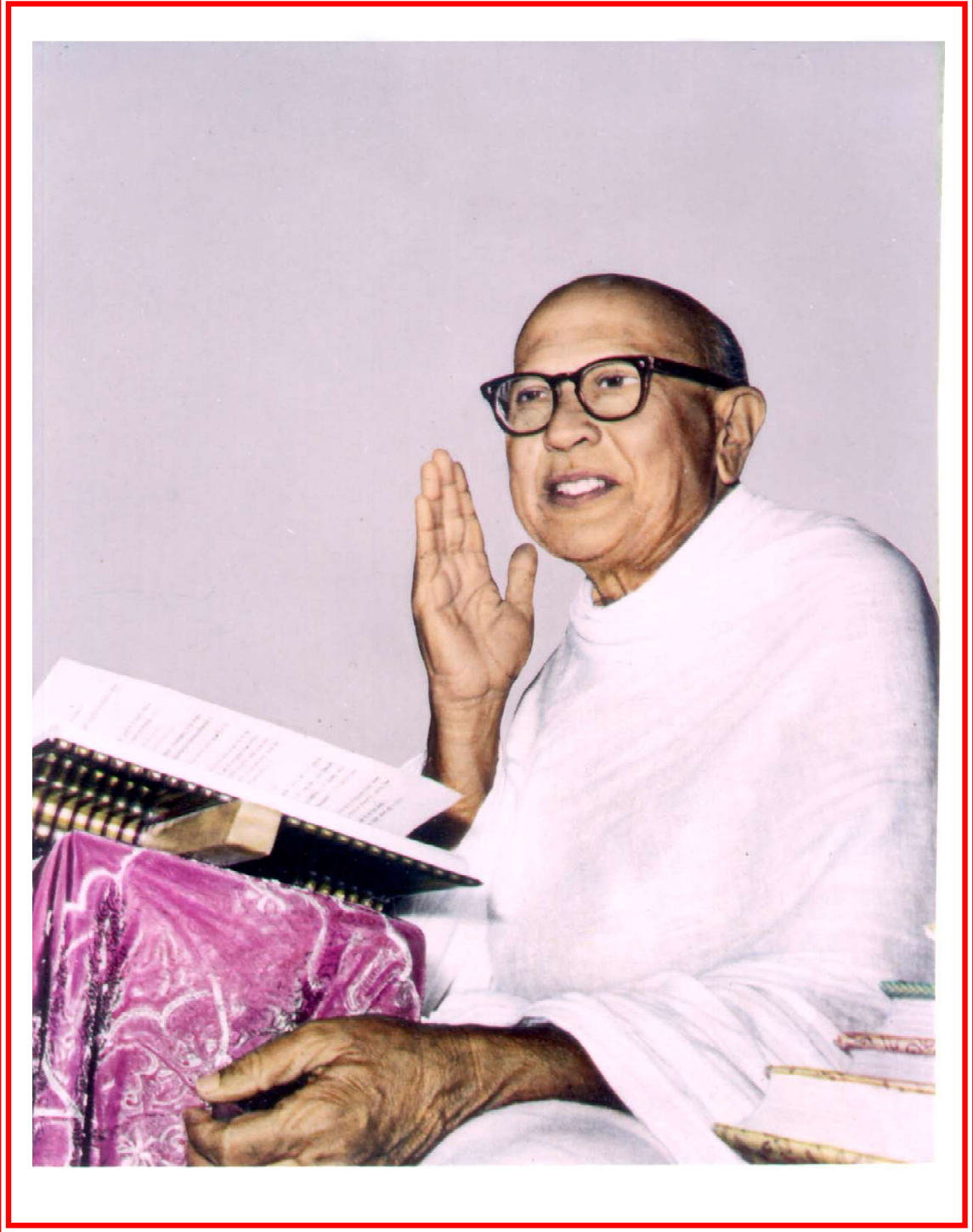
અધ્યાત્મયુગસર્જક પૂજ્ય ગુરુદેવશ્રી કાનજીસ્વામી