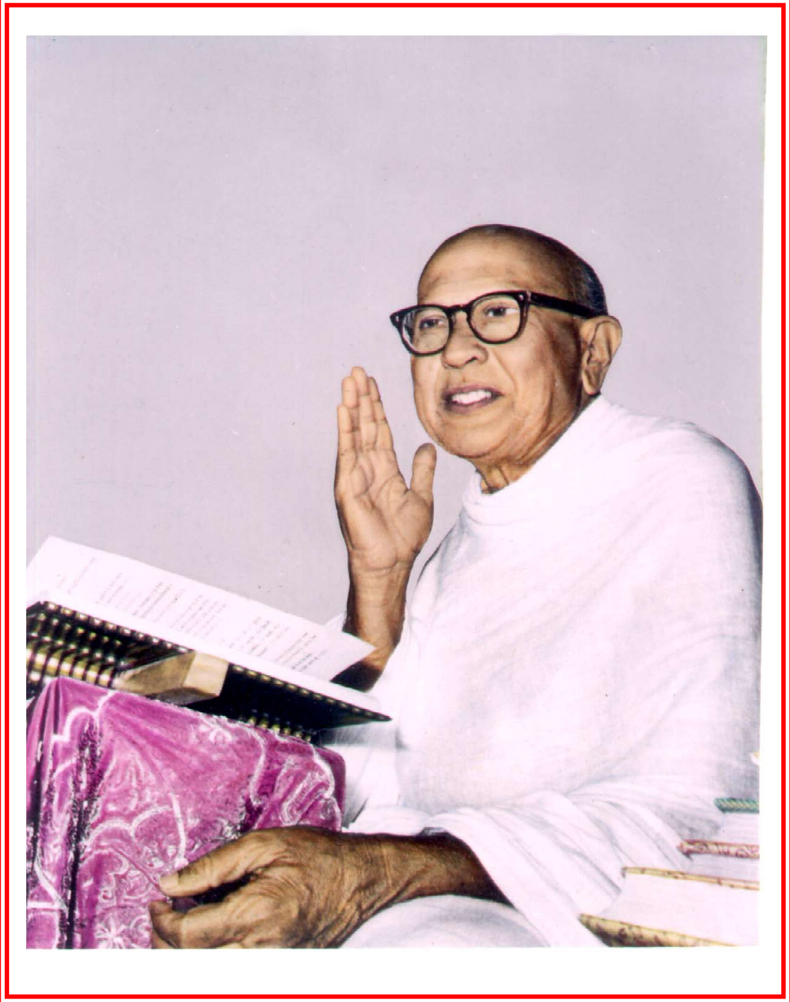
અધ્યાત્મયુગસર્જક પૂજ્ય ગુરુદેવશ્રી કાનજીસ્વામી