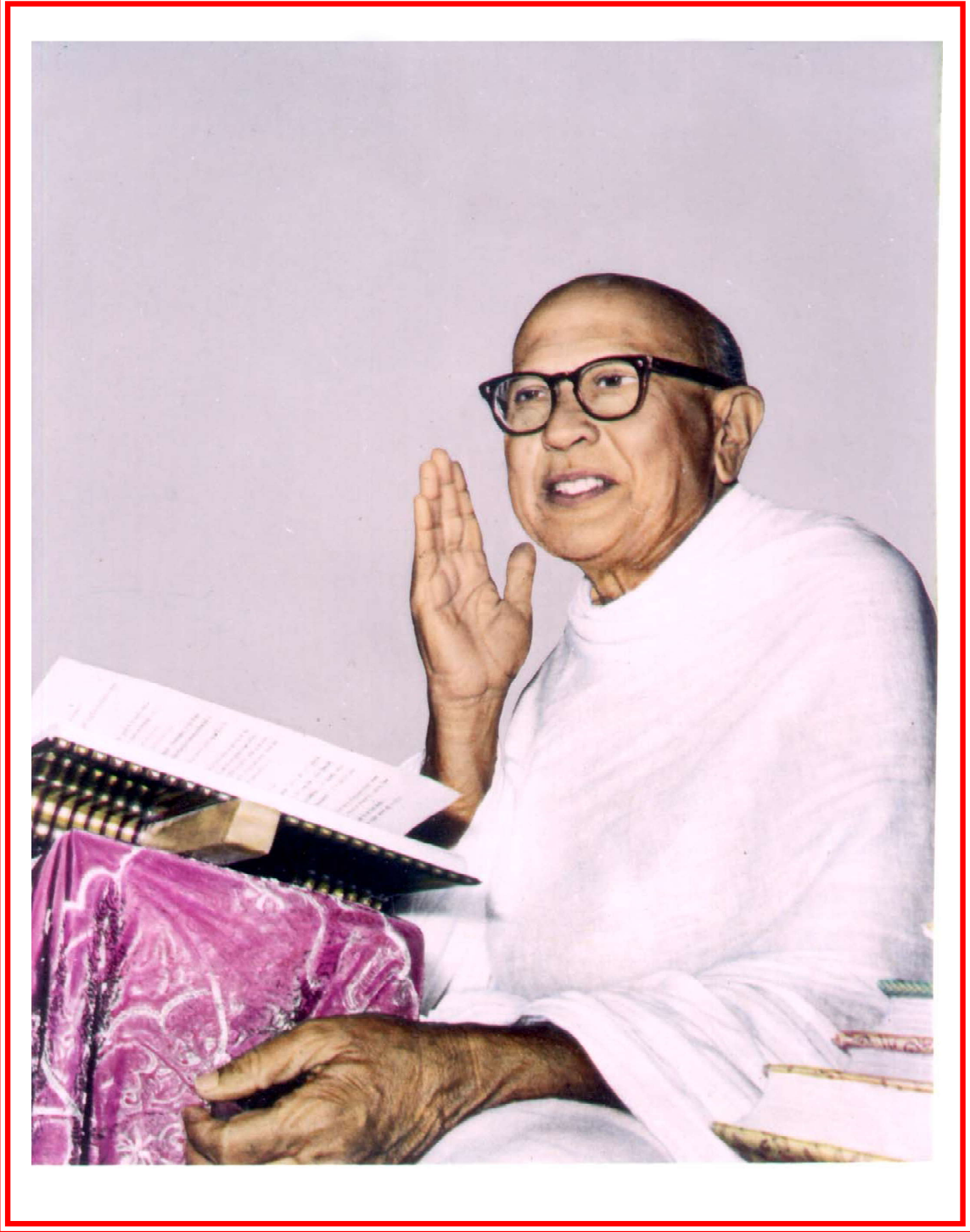
अध्यात्मयुगसर्जक पूज्य गुरुदेवश्री कानजस्वामी