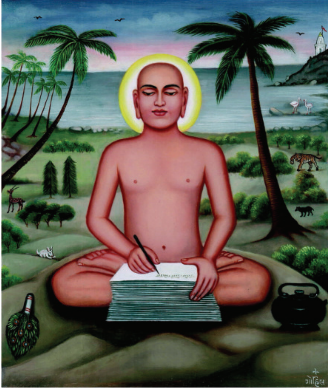
श्रीमद् भगवत् पद्मनन्दि आचार्यदेव