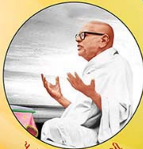
પૂ. ગુરુદેવશ્રી કનજીસ્વામી