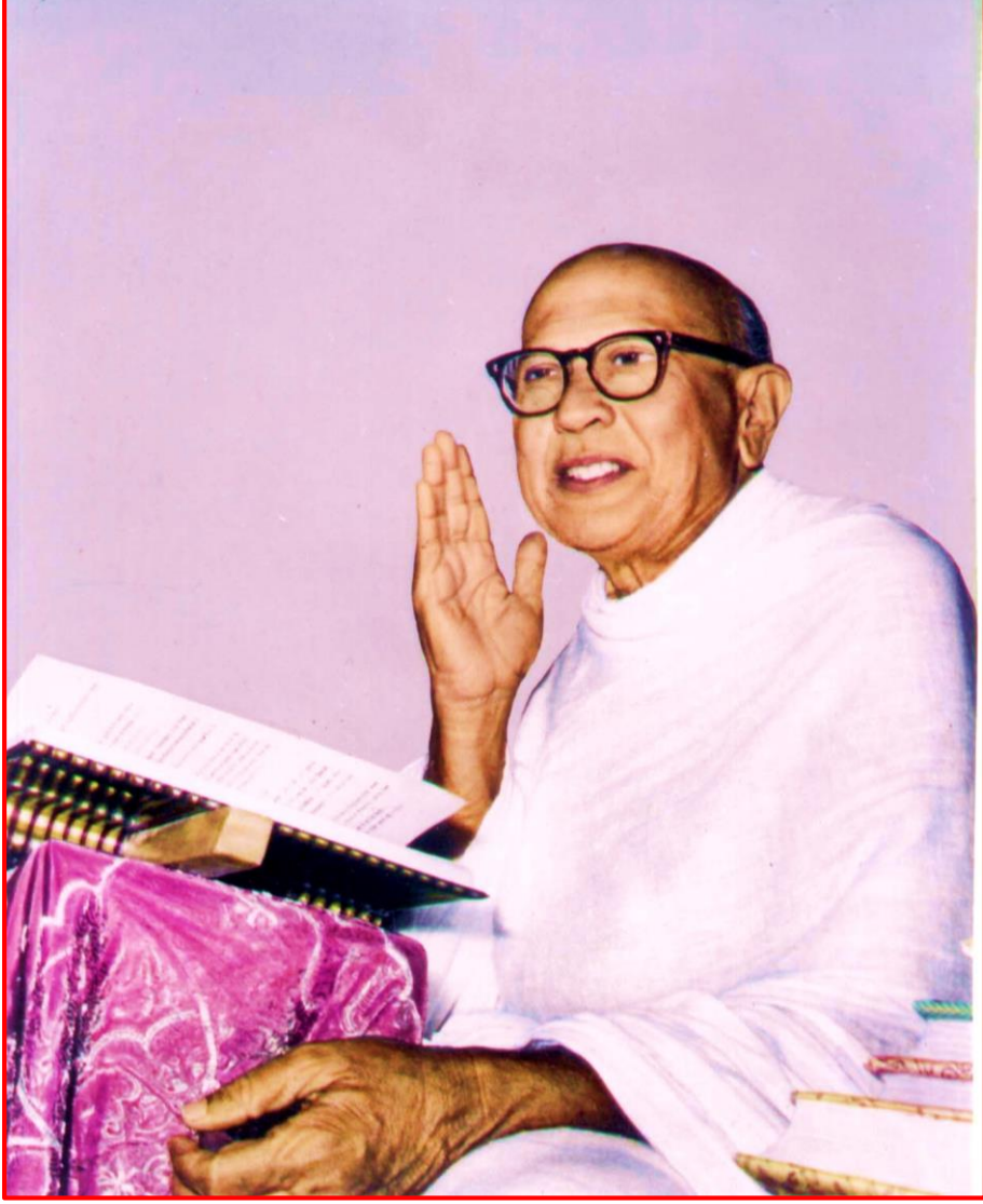
અધ્યાત્મયુગસર્જક પૂજ્ય ગુરુદેવશ્રી કાનજીસ્વામી