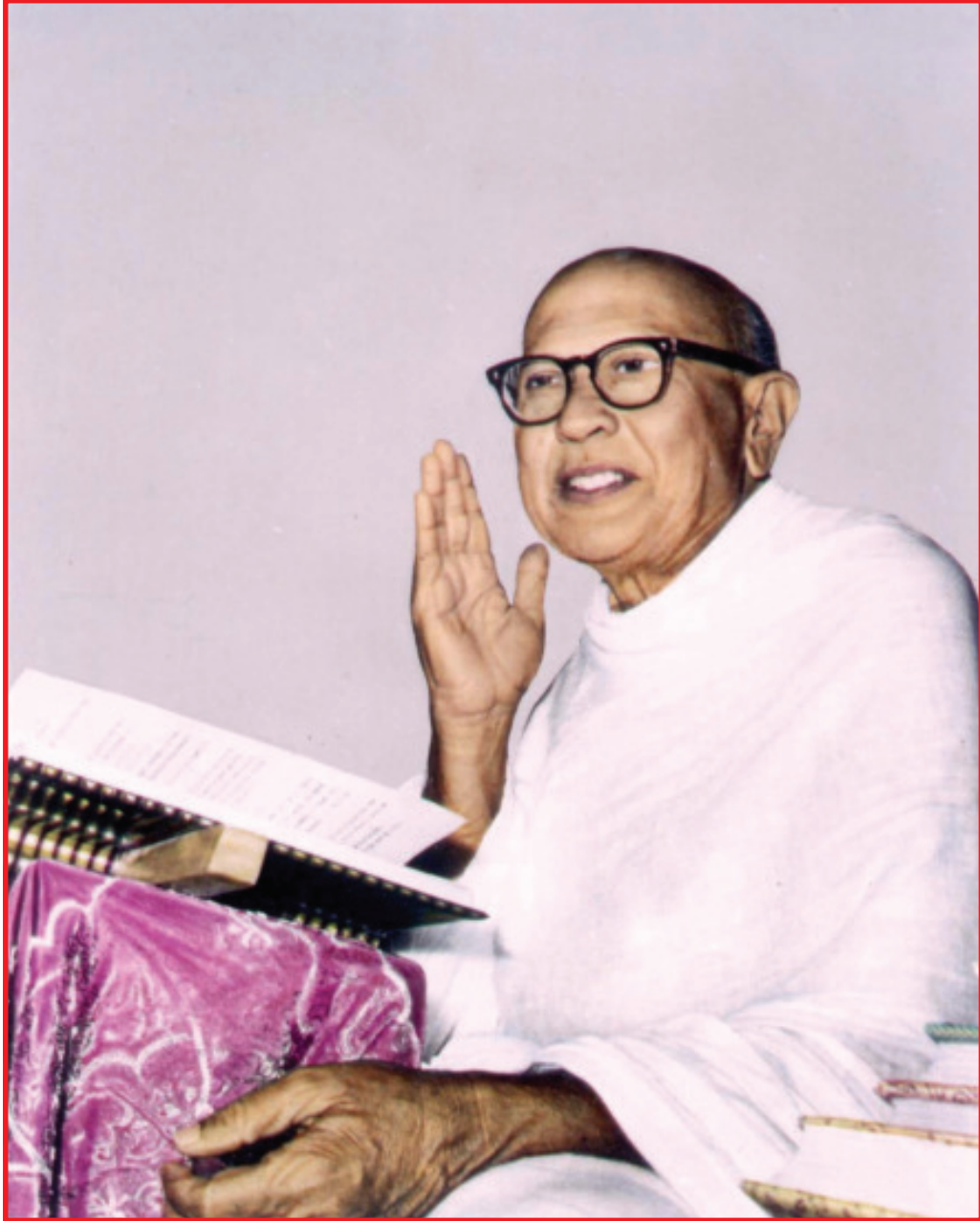
अध्यात्मयुगसर्जक पूज्य गुरुदेवश्री कानजीस्वामी