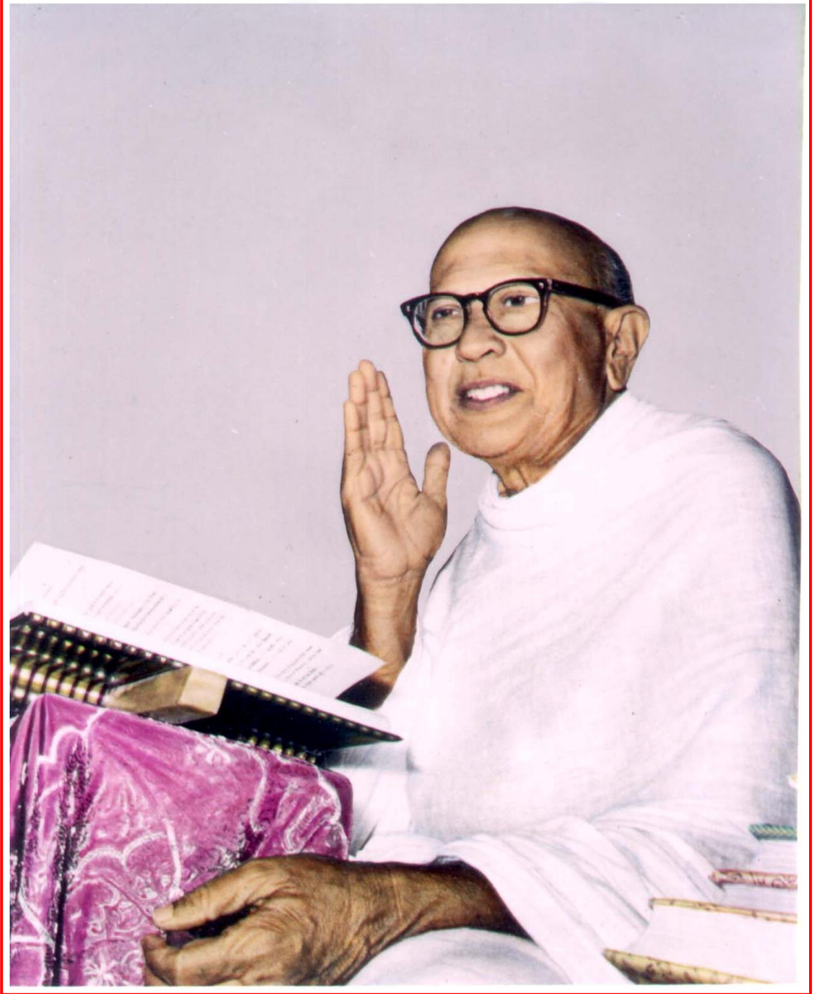
અધ્યાત્મયુગસર્જક પૂજ્ય ગુરુદેવશ્રી કાનજીસ્વામી