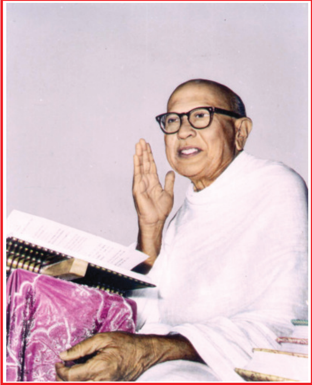
अध्यात्मयुगसर्जक पूज्य गुरुदेवश्री कानजीस्वामी