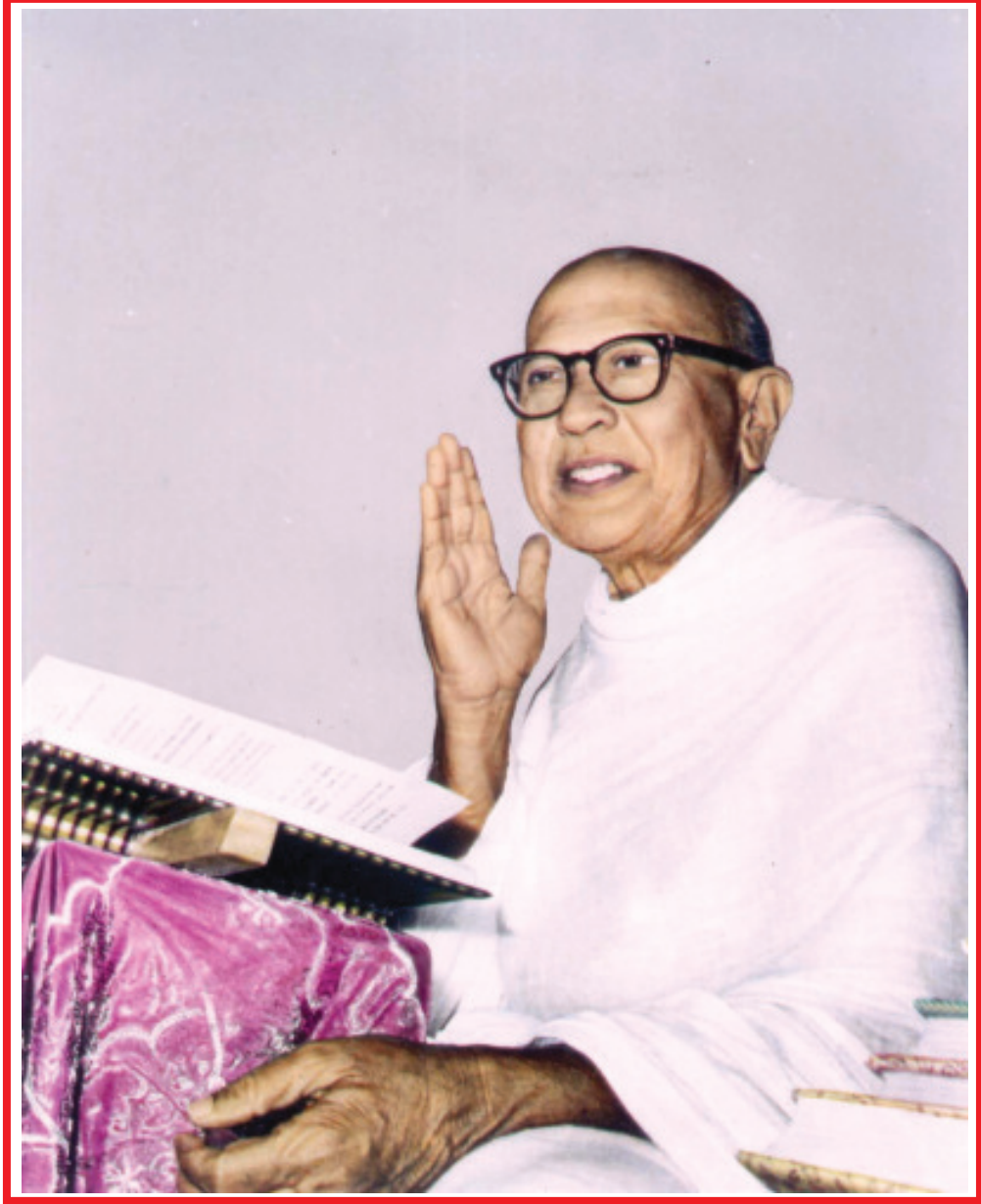
अध्यात्मयुगसर्जक पूज्य गुरुदेवश्री कानजीस्वामी